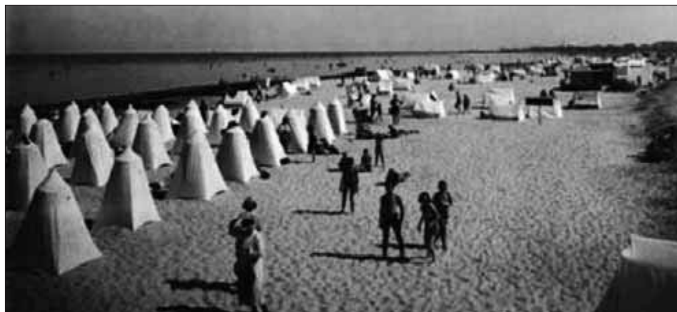
Det var tider! Da der var omklædningstelte på Amager Strand, her omkring 1940.

kolossale mængder sand ind på stranden, og alligevel skulle man »halvvejs til Sverige«, før vandet nåede en til livet. Vandet tog sandet med sig ud igen når det stormede, indtil man i 1949 byggede et lavt bolværk i næsten hele strandens længde. Stykket fra fortet og ned til Kastrup var derimod sikret med store kampesten til beskyttelse af denne stræknings asfaltpromenade.