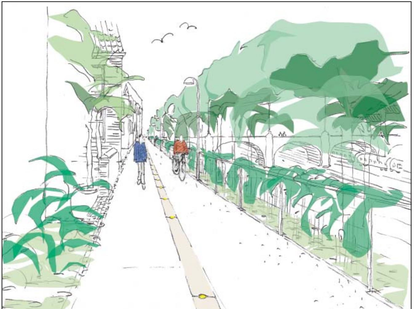
Hallssti - fornyet

Der sættes nyt hegn mod baneskråningen, og det beplanteres med slyngplanter. Bag hegnet anlægges en zone med bunddække. Skråningens træer og buske bevares som de er.